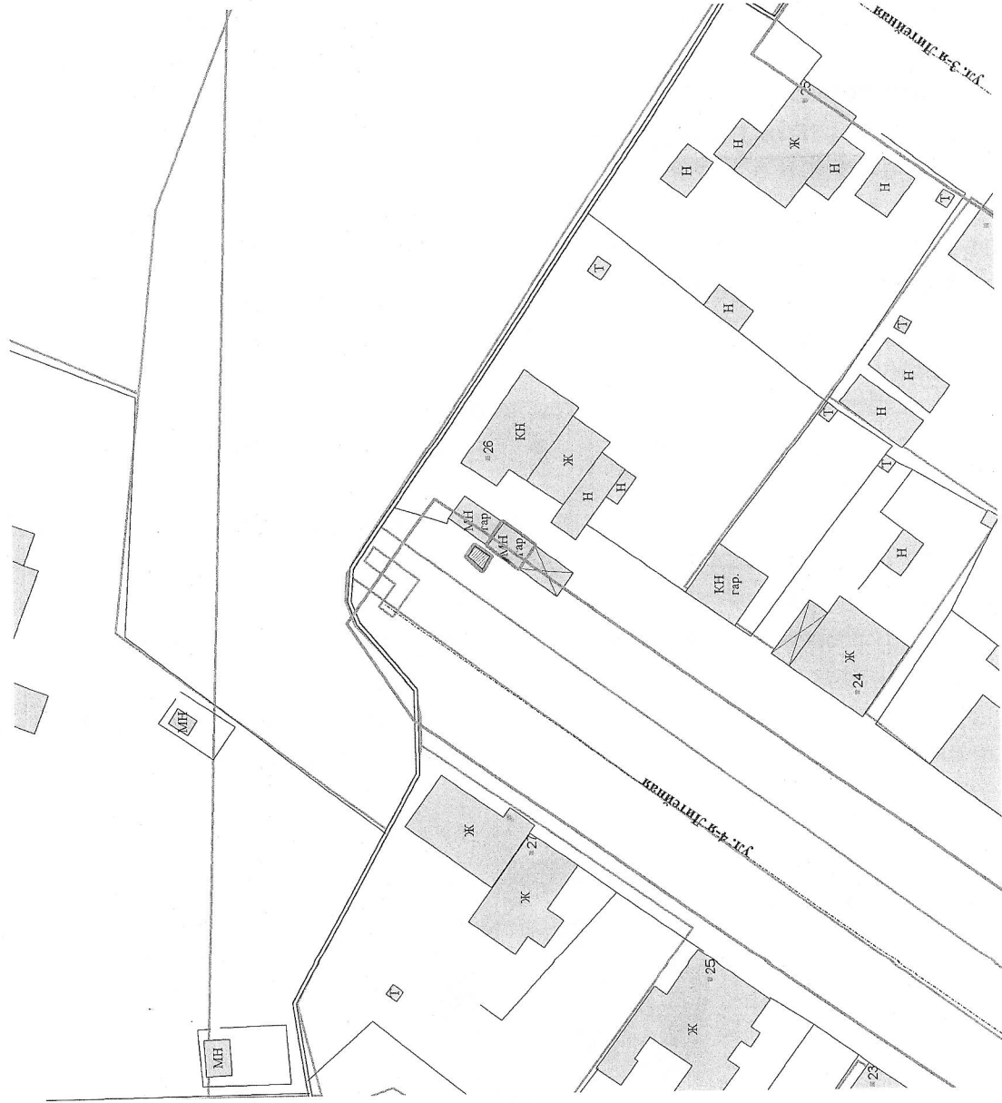
Схема по адресу: Ивановская область, город Иваново, улица 4-я Литейная, у дома 26 М 1:500