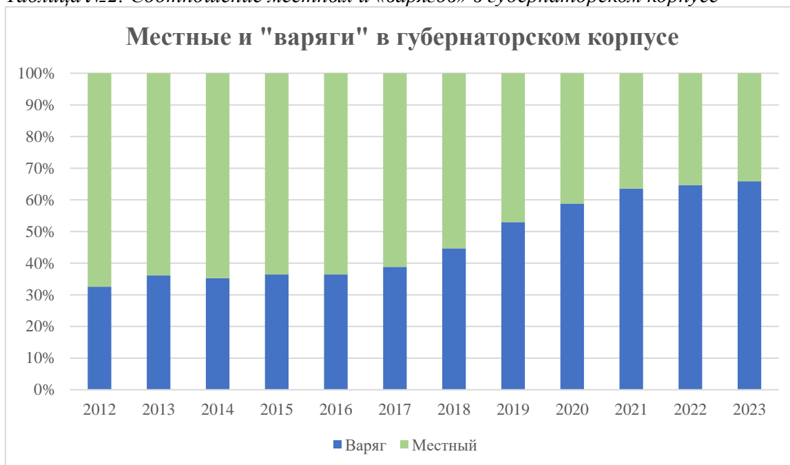
Таблица №2. Соотношение местных и «варягов» в губернаторском корпусе

Формирование нового состава Правительства РФ и Администрации президента после марта 2024 года повышает вероятность того, что некоторые губернаторы могут войти в обновленный состав федеральных органов власти. Тем более, что ряд губернаторов-«технократов» уже переизбран на второй срок и заинтересован в повышении до федерального уровня. Назначение на должности федеральных министров губернаторов Владимира Якушева (Тюменская область) и Дмитрия Кобылкина (ЯНАО) 2 в 2018 году, а затем Максима Решетникова в Минэкономразвития подтверждают возможность подобного сценария. Уже сейчас можно отметить потенциальные кандидатуры в губернаторском корпусе, которые могли бы перейти на федеральный уровень, учитывая опыт работы в руководящих структурах центральной власти и наличие прочных позиций в системе Политбюро 2.0: